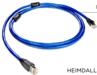
BLUE HEAVEN 3

Por favor, asegúrese de utilizar cables apropiados para el nivel de rendimiento que desea lograr. Para obtener mejores resultados, considere los cables Ethernet de Nordost.